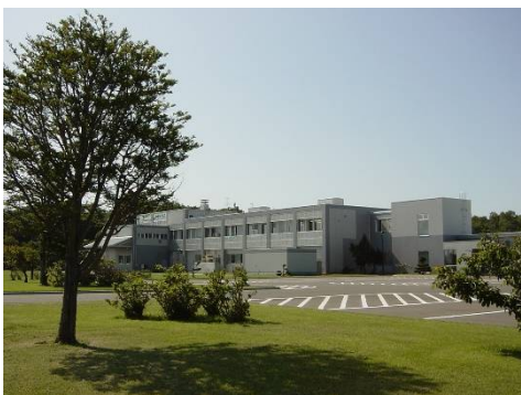
●株式会社べつかい乳業興社

これらの施設においては、HACCP導入などにより食の安全・安心に対応する取組も進められています。