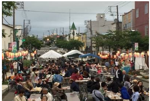
●H27 第3回したまち商店街にぎわいまつり (根室市)