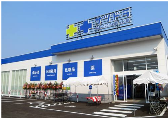
●大規模小売店舗 サッポロドラッグストアー (中標津町)