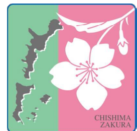
北方領土返還要求運動の シンボルの花「千島桜」