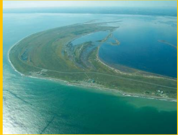
「野付半島」 (標津町、別海町)