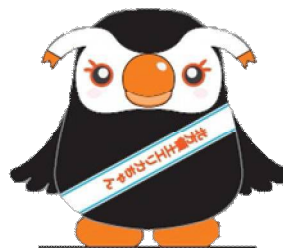
北方領土イメージキャラクター 「エリカちゃん」

●編集・発行 北海道根室振興局地域創生部地域政策課 〒087-8588 北海道根室市常盤町3丁目28番地 Tel. 0153-24-5572 FAX. 0153-23-6182 ホームページアドレス http://www.nemuro.pref.hokkaido.lg.jp