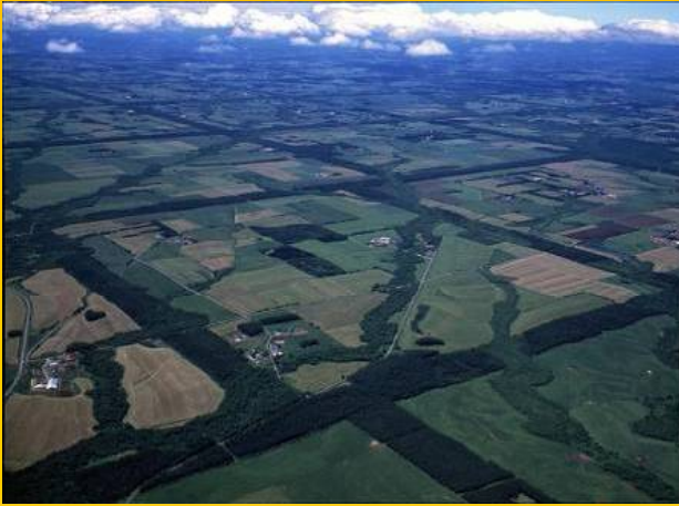
「根釧台地の格子状防風林」 (中標津町など)

「次世代に引き継ぎたい北海道ならではの宝物」、それが北海道遺産です。豊かな自然や北海道に生きてきた人々の歴史、文化、生活・産業など様々な有形無形の財産の中から、道民参加によって選ばれました。