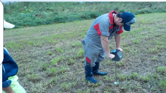
草地の硬度調査（草地改善プロジェクト）