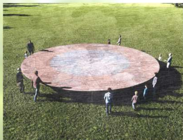
4 Plate (of 100 meters arc)