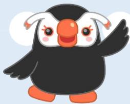
北方領土のイメージキャラクター えとぴりかの「エリカちゃん」