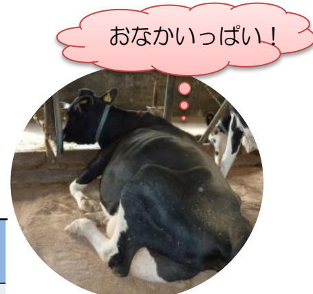
たくさん食べたから腹の左側がはってるよ!