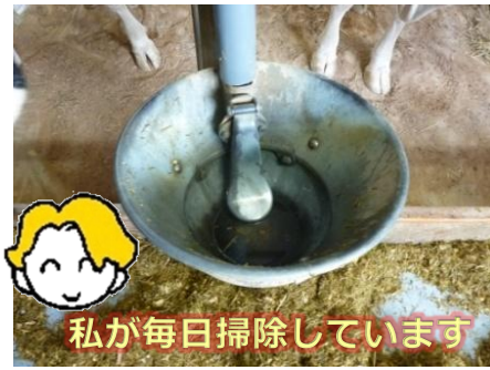
キレイな水がたくさん飲める