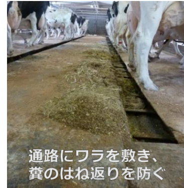
通路にワラを敷き、 糞のはね返りを防ぐ