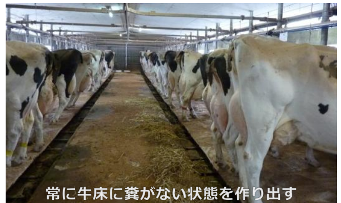
常に牛床に糞がない状態を作り出す