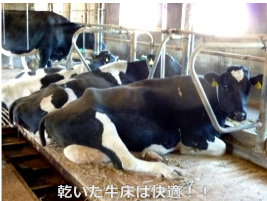
乾いた牛床は快適！！