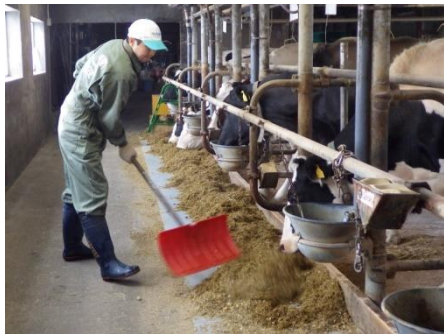
頻繁なエサ寄せで、目の前にいつでもエサがある