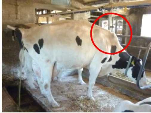
〈カウトレーナー〉 排尿姿勢をコントロールして、尿が尿溝に落ちるように。 牛床に斜めに立たないようにチェーンを垂らしている牛床もあります。