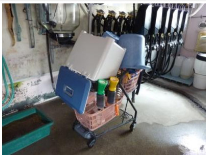
搾乳ツールは洗って乾燥させます