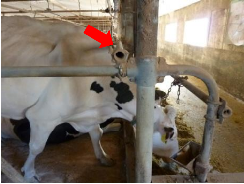
〈立ち位置を調整するバー〉 牛床の前方に立つと牛床を汚すため設置。 このバーがあると、遠くのエサに届きにくくなるため、 エサ寄せは欠かせません！