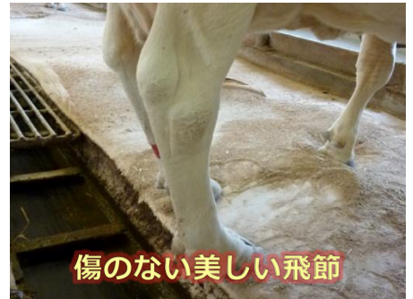
延長した牛床と柔らかいマットレス