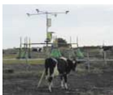
写真20 自作ブラシ(ほうき利用)