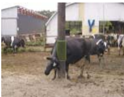
写真19 自作ブラシ(玄関マット利用)

ブラッシングする時間が無い場合は、施設の一部にブラシや代用品（プラスチック製の玄関マットなど）を設置することもストレス解消に有効です。