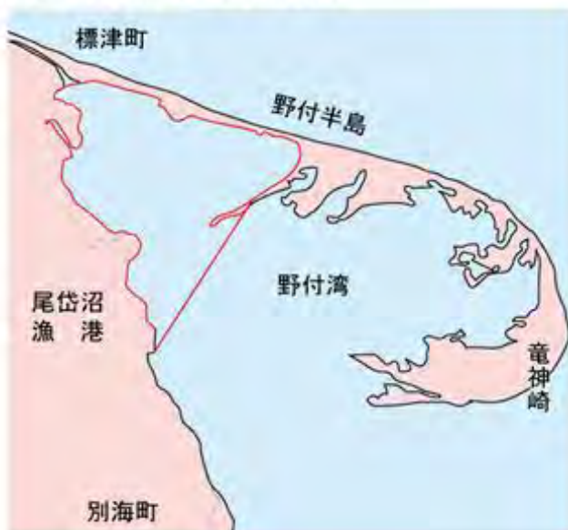
別図② 野付湾内禁止区域概略図