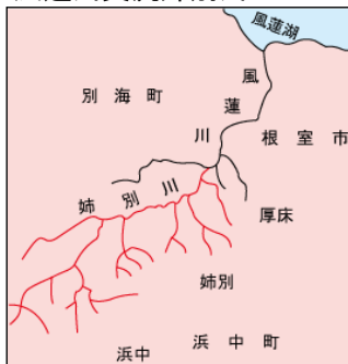
風蓮川支流姉別川