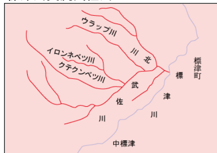
標津川支流武佐川