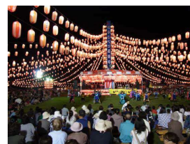
●なかしべつ夏祭り