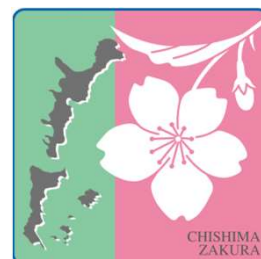
北方領土返還要求運動の シンボルの花「千島桜」