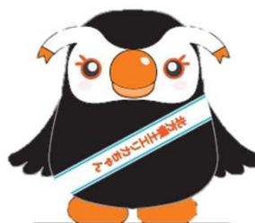
北方領土イメージキャラクター 「エリカちゃん」

北海道根室振興局地域創生部地域政策課 〒087-8588 北海道根室市常盤町3丁目28番地 Tel. 0153-24-5572 FAX. 0153-23-6182 ホームページアドレス http://www.nemuro.pref.hokkaido.lg.jp