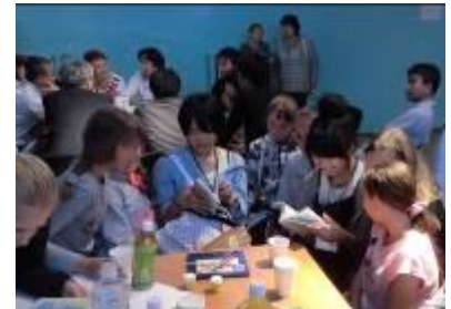
北方四島への訪問 (国後島での青少年住民交流)

北方領土問題が解決されるまでの間、相互理解の増進を図り、領土問題の解決に寄与することを目的として行われている旅券・査証なしによる日本国民と北方四島在住ロシア人との相互訪問事業で、1992年から事業実施団体が実施しています。