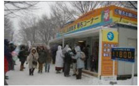
さっぽろ雪まつり会場での署名活動

また、1965年から始められた「北方領土返還要求署名」については、全国各地の関係団体などが積極的に署名活動に取り組んでおり、2021年3月時点での総署名数は9,200万人を越えています。