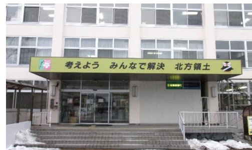
根室振興局正面玄関