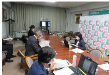
振興局会場の様子