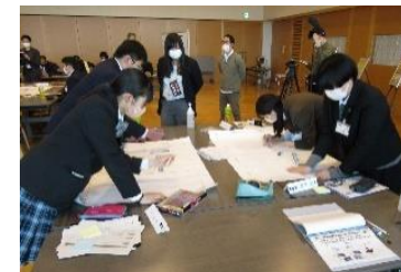
グループワークの様子（Aグループ）