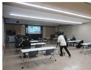
振興局会場の様子