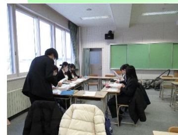
2/1ブレインストーミングの様子