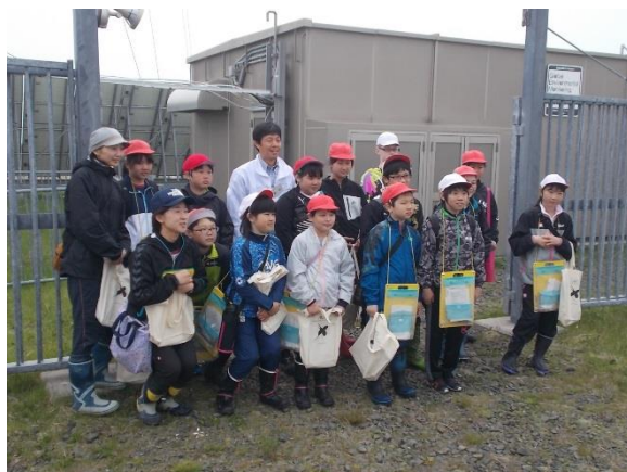
施設前の記念撮影