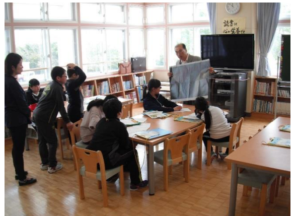
地球のどの地域で電気がよく使われているかみてみよう