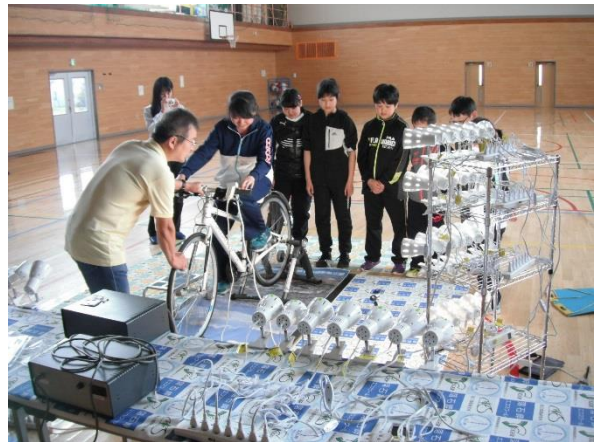
発電の大変さを実感しました