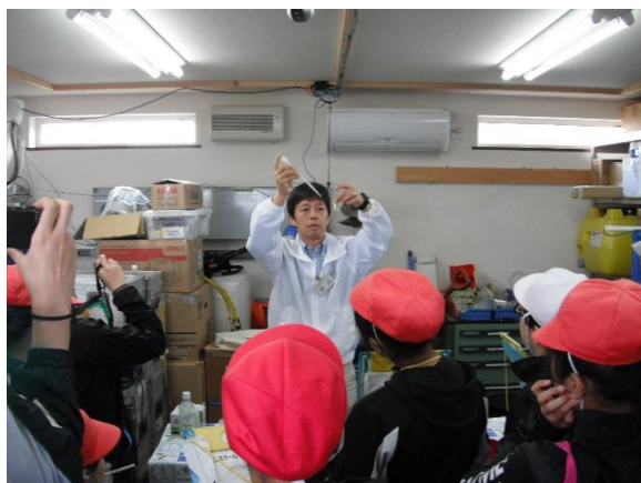
BTB溶液に呼気を入れる実験