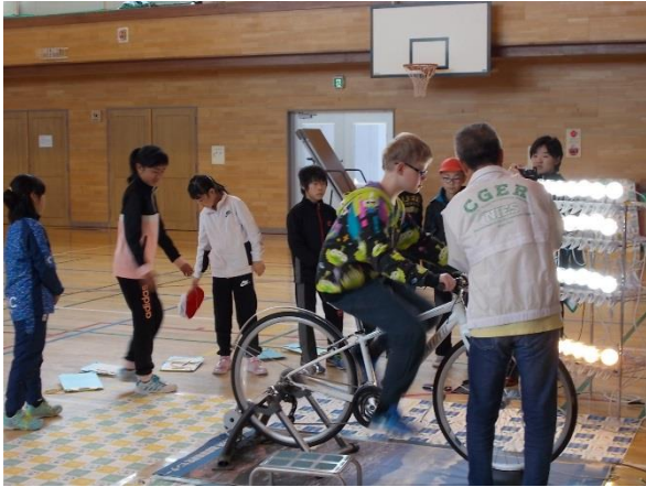
自転車をこいで、電化製品を動かしてみよう