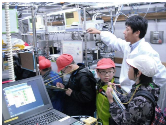
観測機器の説明を熱心に聞く子どもたち