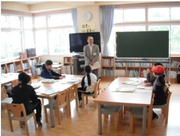
温暖化の影響について勉強しました