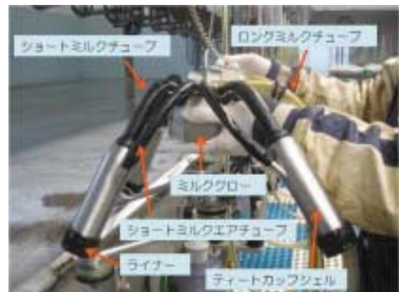
写真2 ユニットの名称