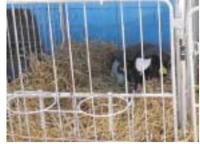
写真3 清潔な個室へ

生まれたての仔牛は細菌から身を守る「免疫」を持っていません。他の牛や動物からの感染を防ぐため、すぐに「乾いた清潔な個室」へ移動させましょう（写真3）。