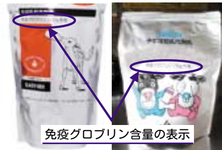
写真4 免疫グロブリン量が分かるものを使用する（表示の例）