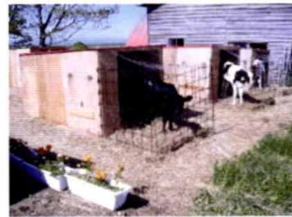
写真2 上写真にハッチ設置後の様子