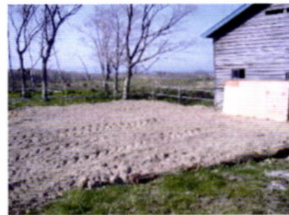
写真1 カーフハッチ設置場所に火山灰を敷く

ハッチやペンは、排水性が良いところに設置します。ハッチは火山灰などの排水性の良い資材を敷いて一段高くしたところに設置し(写真1,2)、火山灰は排水性が悪化する前に定期的に交換してください。ほ育舎の床は水勾配をつけ水がたまらないようにします。床が土間の場合はハッチ同様定期的な火山灰入れ替えが必要となります。