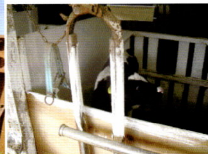
写真4 子牛の口が届く範囲に石灰塗布(個別ペン)