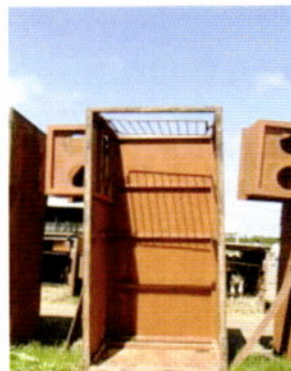
写真3 カーフハッチの日光消毒