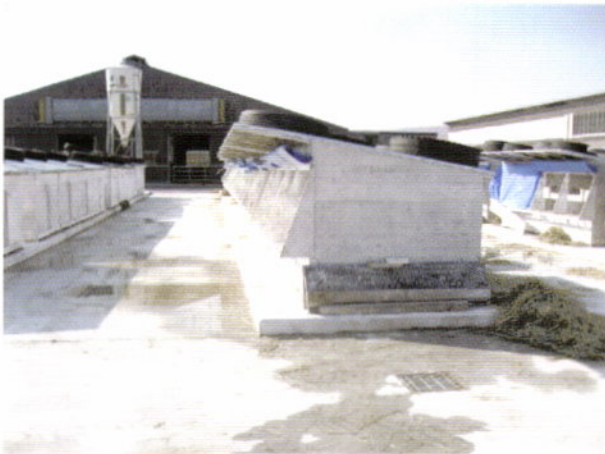
写真2 屋根を延長して日陰を作った事例