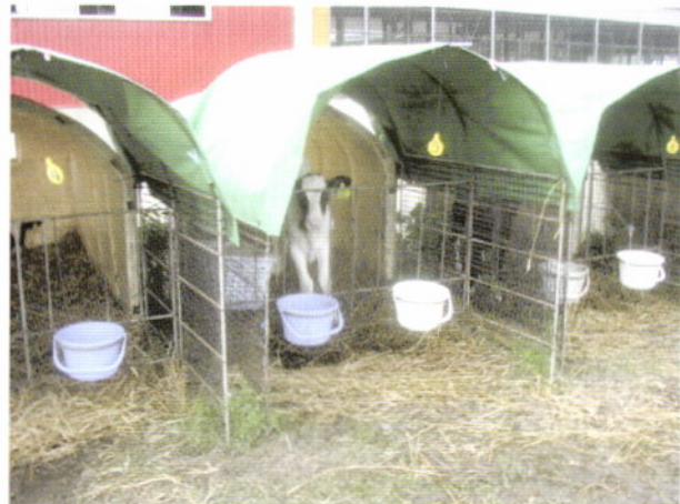
写真3 運動場の上にカバーをかけて日陰を作った事例