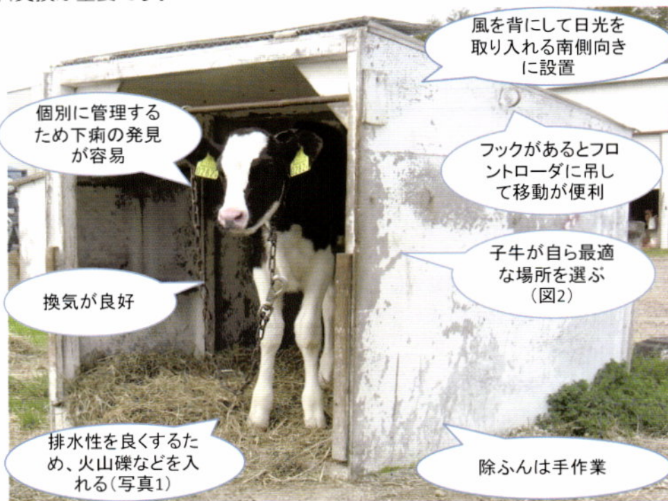
図1 カーフハッチの特徴

カーフハッチは、構造上大きく重たく、手作業による除ふんが基本となります。こまめな除ふんと敷料交換が重要です。