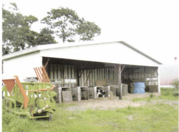
写真5 屋根の下にハッチを設置し作業性を良くした事例