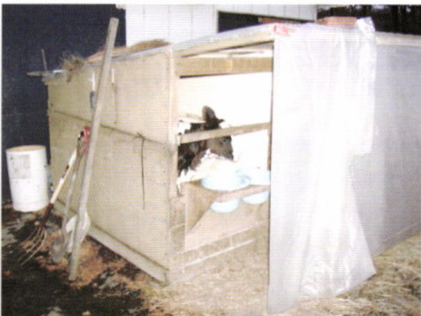
写真4 ビニールシートによる冬の寒さ対策事例