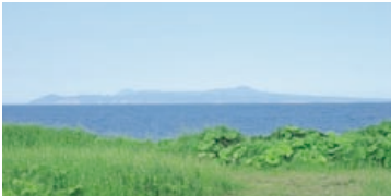
（望洋台からの眺め）

標津十景は、このほか「標津市街の夜景（野付半島から）」「漁船の船出風景と朝日」があります。