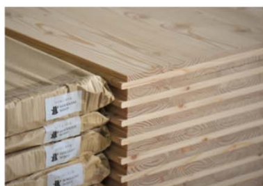
自社製品（例：製品ラベルへの印字）