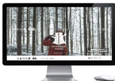
WEB上の使用（例：自社サイトでの活用）