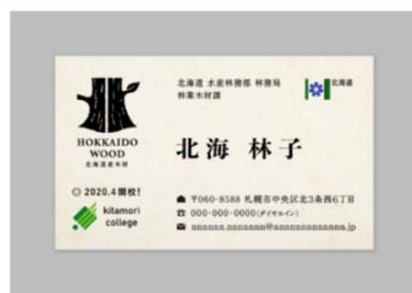
印刷物への使用（例：名刺）