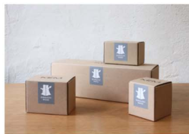
自社製品（例：製品パッケージへの印字）