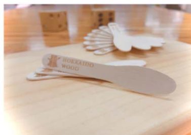
自社製品（例：製品への印字）