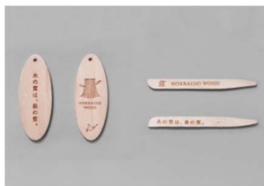
販促グッズ（例：木製キーホルダー、菓子楊枝）

道産木材製品の魅力を伝えたいという思いをもつ企業や、応援してくださる方などが、様々な場面でロゴを使用し、HOKKAIDO WOODを広めています。