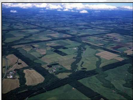
「根釧台地の格子状防風林」 (中標津町など)

「次世代に引き継ぎたい北海道ならではの宝物」、それが北海道遺産です。豊かな自然や北海道に生きてきた人々の歴史、文化、生活・産業など様々な有形無形の財産の中から、道民参加によって選ばれました。