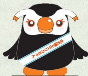
北方領土イメージキャラクター 「エリカちゃん」

●編集・発行 北海道根室振興局地域創生部地域政策課 〒087-8588 北海道根室市常盤町3丁目28番地 Tel. 0153-24-5572 FAX. 0153-23-6182 ホームページアドレス http://www.nemuro.pref.hokkaido.lg.jp