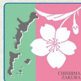
北方領土返還要求運動の シンボルの花「千島桜」