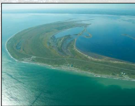
「野付半島と打瀬舟」 (別海町、標津町)