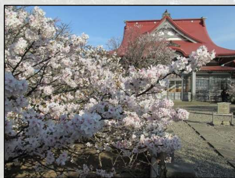
「千島桜」 (北海道各地)