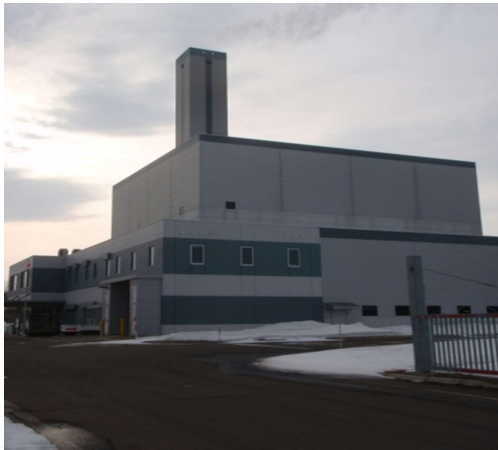
●根室北部廃棄物処理広域連合焼却施設（別海町）