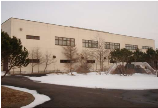
●下水終末処理場（根室市）

管内の水道普及率は99.0%と全道平均(98.3%)を上回り、また、汚水処理人口普及率は85.9%で、全道平均(96.5%)を下回っています。