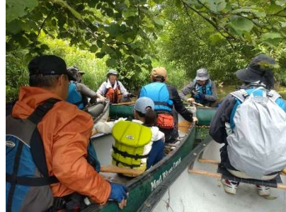
●ポー川史跡自然公園でのカヌー体験（標津町）

管内にある史跡自然公園、郷土資料館等の施設では、土器づくり体験や発掘体験などを行っており、また、関係団体等と連携した様々なイベントを実施しています。