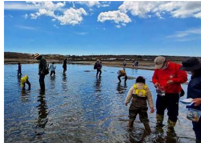
●歴史と自然の資料館主催の干潟の観察会（根室市）