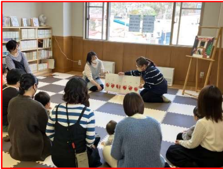
●読み聞かせサークルの協力による「ちいさい子のおはなし会」（羅臼町）

管内では、図書館を活動の拠点として、図書館ボランティア、読み聞かせボランティア、読書会等の団体が活発に活動し、子どもの読書活動推進の一翼を担っています。