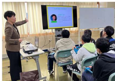
● 地域おこし協力隊の方を講師とし、よりよい情報発信の方法について学ぶ児童

管内では、各教科等や総合的な学習の時間などにおいて、地域の教育資源を活用し、外国人向けに地域の魅力を発信する学習や、地域の特産物を使った調理実習など、各地域の特色を生かした教育活動を充実させることにより、その地域のよさを発見し、誇りや愛着をもつ児童生徒を育成するふるさと教育を推進しています。