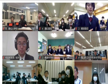
● 小・中学生、高校生による校種の枠を超えたオンラインによる話し合い

管内では、小・中学生、高校生が校種の枠を超えて協力し、いじめ（ネットトラブルを含む）の根絶に向けて学校や地域で取り組むべき内容を協議し、管内における「仲良しコミュニケーション活動」の充実に向けた取組を推進しています。