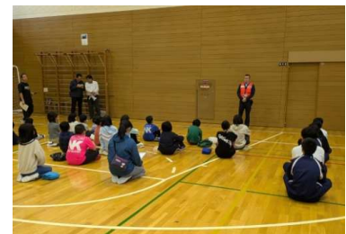
● 幼稚園、小・中学校で行った合同避難訓練