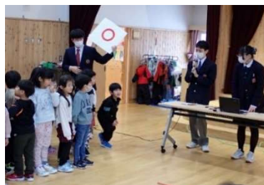
● 町内のこども園での防災出前授業

管内では、異校種間連携により、高等学校が、被災地研修等を通して学んだ知識や経験を町内のこども園、小・中学校等を訪問し学んだことを伝える出前授業や、学校運営協議会及び地域と連携し、幼稚園、小・中学校で行う合同避難訓練など、防災教育の充実に向けた取組を推進しています。