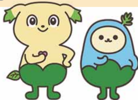
たもちい そよりん

まずは最寄りの森林組合までご相談ください。内容に応じて、ご希望に沿ったお見積もりをご案内いたします。