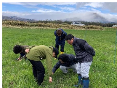
写真2 追播の発芽状況を確認 (草地管理部会と連携)