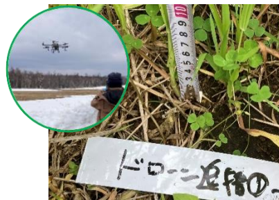
写真1 ドローンによる追播効果 (マメ科率の向上)