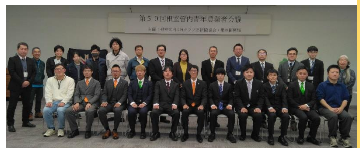
写真8 第50回根室管内青年農業者会議

また、過去10年の根室管内4Hクラブ連絡協議会会長よりメッセージをいただき、掲示にて紹介しました。