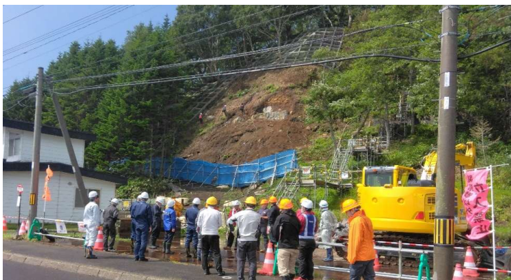
高所作業時の保安状況を確認 （林務課_所管@なだれ予防柵設置工事）

現場事務所にて工事監督員、現場代理人より地区概要・現場管理状況の説明を受け、「保安対策」や「交通安全対策」など5つの点検項目について書類と現場の点検を行いました。