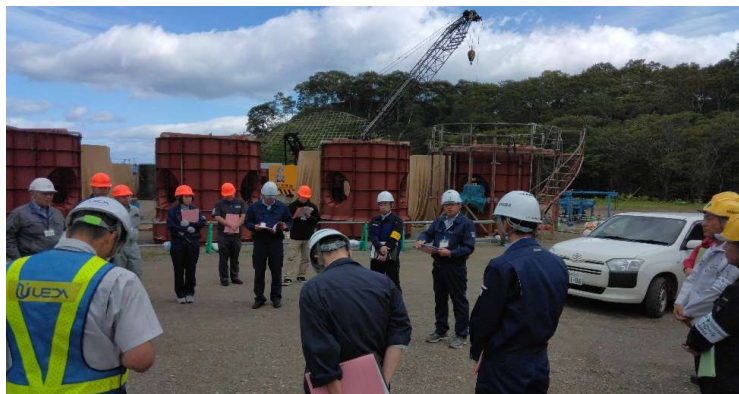
魚礁ブロック制作現場で所振興局長の講評 （水産課_所管@魚礁製作設置工事）

根室振興局では、公共事業の計画的な推進のため、毎年度、各工事現場が無事故・無災害で終われるよう、より一層の安全対策や安全衛生教育等の取組を積極的に進めていきます。