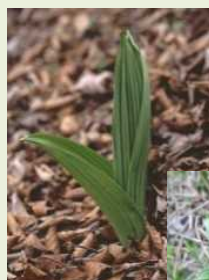
芽出し期 のバイケイソウ