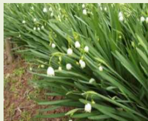
スノーフレーク （スズランスイセン）