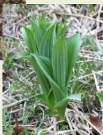
芽出し期 のコバイケイソウ