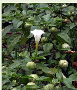
チョウセンアサガオの葉と花