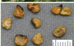
チョウセンアサガオの種