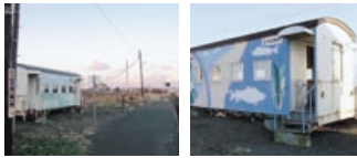
(改造駅舎 西和田駅・別当賀駅)

北海道の駅には無人駅が多くあります。その無人駅にある列車車両を使った待合所が車掌車改造駅舎なのです。本州の一部の地域にもありますが、その殆どは北海道にあります。北海道らしい駅舎をお楽しみ下さい。