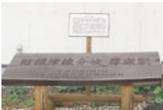
(厚床駅分岐点記念碑)

1919(大正8)年設置。根室管内で初めて設置された駅。1933(昭和8)年からは標津線の開業に伴い分岐駅となる。ホームには今でもその(分岐駅)記念碑が置いてあるヨ。