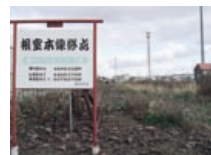
(根室本線最終地点)