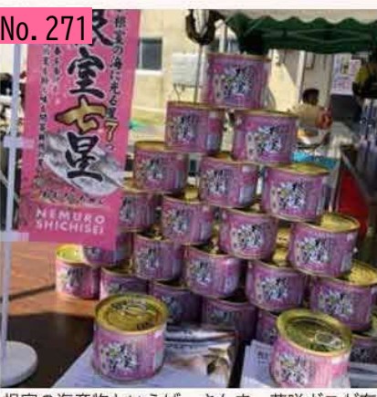
根室の海産物といえば、さんま、花咲ガニが有 名ですが、マイワシの「根室七星」もありま す!根室のお土産としてぜひおすすめです。 by いわしちゃん