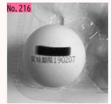
2月7日は「北方領土の日」です。領土返還を心 から強く望みます。 by masuku-man