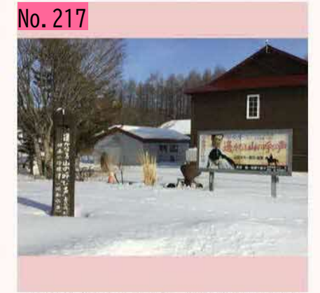
山田洋次監督の名作映画「遙かなる山の呼び 声」は、中標津町が舞台です。笑いあり、涙あ り、そして北海道の雄大さに感動する作品で