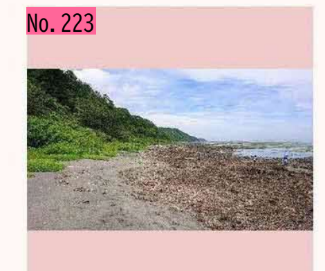
国後島に自由訪問で行った写真です☺言葉のよ うに自由に、行ければ良いと思います。