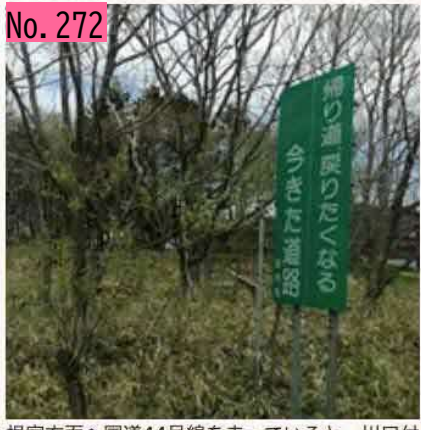
根室方面へ国道44号線を走っていると、川口付 近で左側にこの看板が見えます。「帰り道、戻 りたくなる 今きた道路」。どういう意味なん だろう?見るたび、毎回疑問に思う。