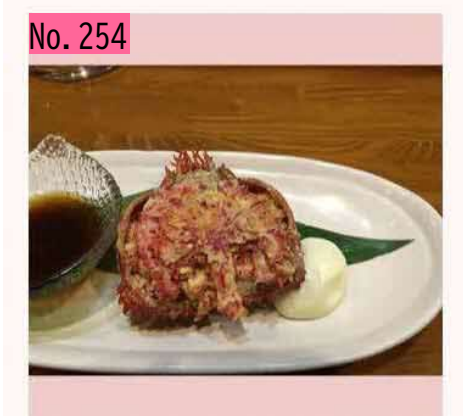
新宿で開催された根室市のふるさと納税感謝祭 でも味が濃いと好評だった花咲ガニ。市内の居 酒屋では、このカニのむき身がビッチリつまっ た甲羅詰めを食べることができます。北の勝に もピッタリです。