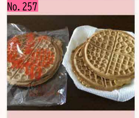
柔らかい食感が特徴の根室のオランダせんべ い。製造しているお菓子屋さんの本店に買いに 行ったところ、袋詰めして間もない、まだほん のり温かいのを売ってもらえました。甘過ぎ ず、飽きがこない味です。よく見ると表面の凸 凹状のパターンが4分の一ずつ異なります。 by のび太