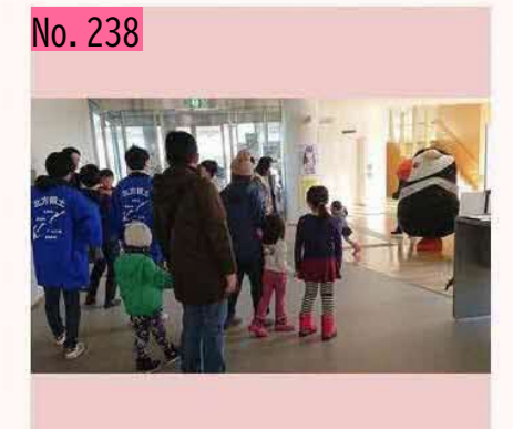
大人気、エリカちゃん!! by とんちゃん