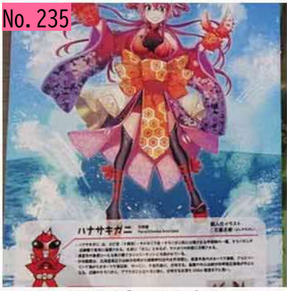
イキモノ図鑑の「ハナサキガニ」です。 by とんちゃん