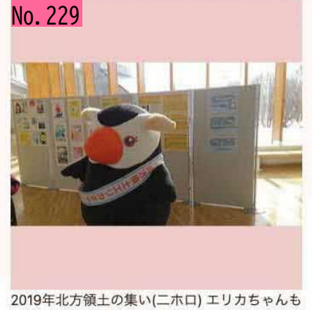
来てますよ(^-^) by 根室振興局です