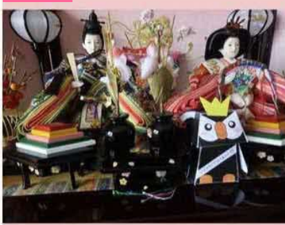
北方領土の集いで作ったエリカちゃん。みんな 一緒にひな祭り。 by <sup>エリカ雛</sup>