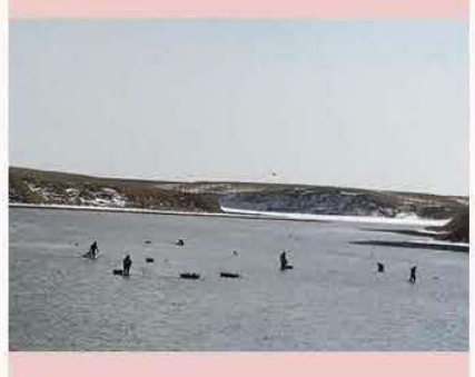
歯舞の"トーサムポロ湖です。まだまだ風が冷 たい中、お疲れさまです。アサリ漁でしょう か。美味しいアサリが皆さんの口に届きますよ うに。 by ネムロッ子