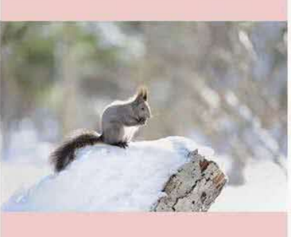
エゾリス食事中♪