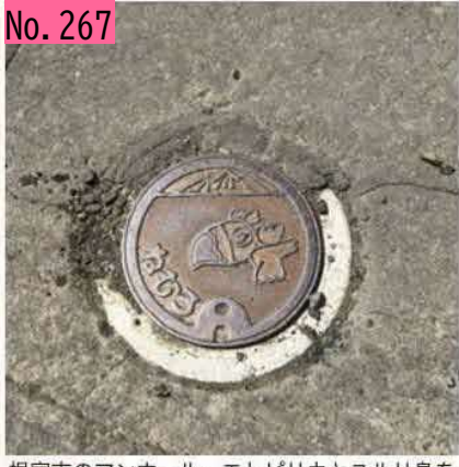
根室市のマンホール。エトピリカとユルリ島を デザインしているようです。他にもいろんなデ ザインがあるみたいです。