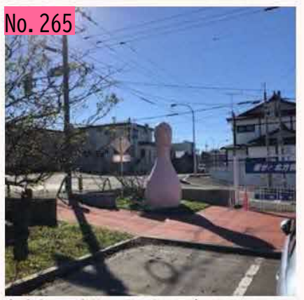
根室市の図書館にバーバパパがいるのはなんで だろう??? by あおぞら