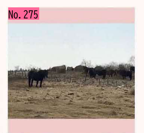
納沙布岬では、かわいいポニーたちが皆さんを 出迎えてくれますヨ。