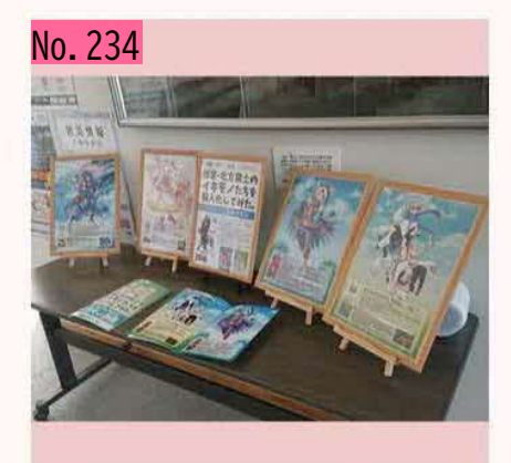
北海道北方領土対策根室地域本部がニホロで開 催している北方領土の集い。 青年会議所のサブ カルミーティングで取り組んでいる北方領土の イキモノ図鑑です。 秀逸! by とんちゃん