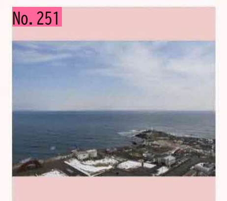
納沙布岬、水晶島@タワー by スナイバーG13