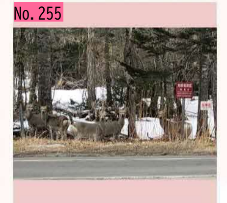
道の駅スワン44ねむろのそばで鹿に会いまし た。日中でも道路脇に鹿がいるので、ドライブ される方はくれぐれもご注意頂きまして、根室 の身近に感じられる自然を楽しんでくださいま