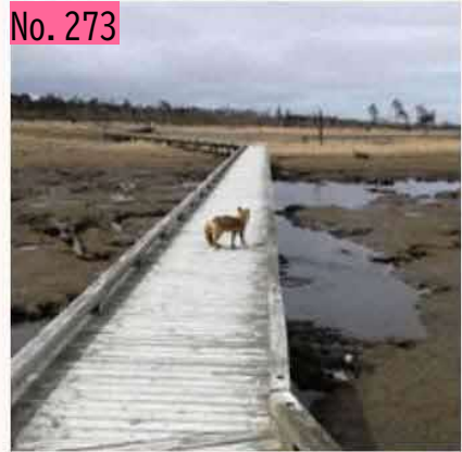
キタキツネにいざなわれ、春国岱の木道を進 む。 by ねむねむ