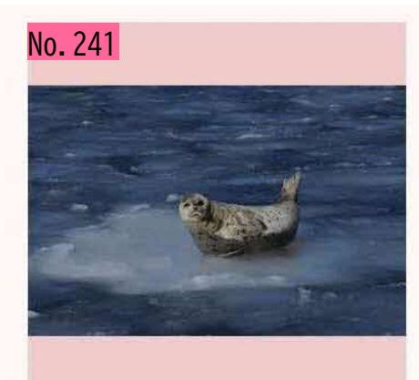
アザラシ、のんびり休憩中。