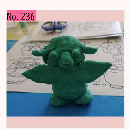
by まき by とんちゃん