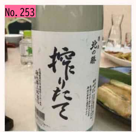
なかしべつ「北の勝」愛好会で、おいしいお酒 をいただきました。北の勝だ〜い好き。四島の ロシア人は日本酒好きなのかな? by いとっち