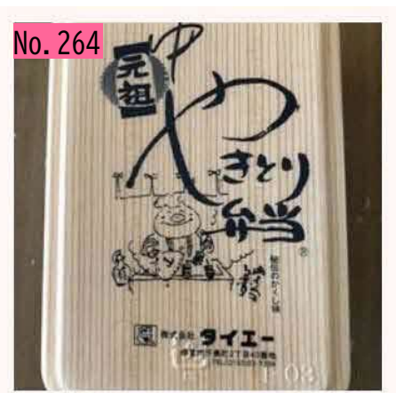
根室名物タイエーさんのやきとり弁当!店舗で は、このお弁当柄の弁当箱も販売しています。 オリジナルTシャツなどのグッズも充実。レト 口感がたまりません。 by やきとり?