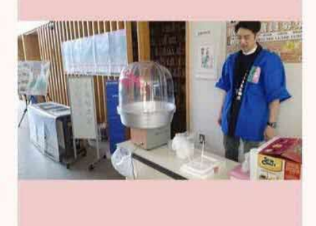
2019年北方領土の集い(ニホロ) 「わたあめ」あ るよ~ © by 根室振興局です