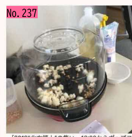
「2019"北方領土"の集い」13:00からポップコ ーン無料配布します!!是非来て下さい! by 根室振興局