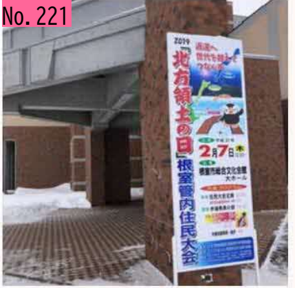
根室管内住民大会、始まります! by さんまちゃん