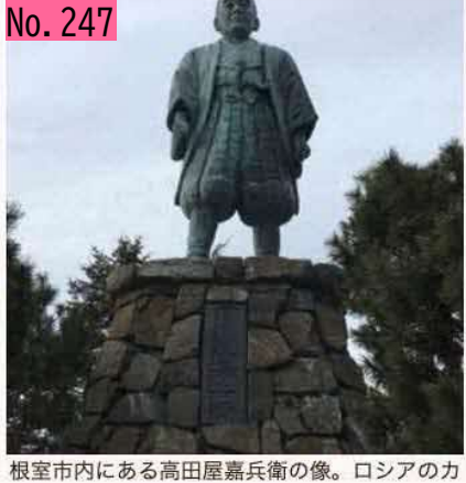
根室市内にある高田屋嘉兵衛の像。ロシアのカ ムチャッカ半島には、ロシア側が高田屋嘉兵衛 の名前を付けた山があるらしい。