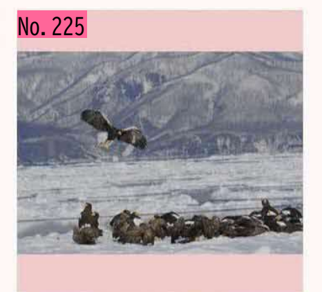
オオワシ&オジロワシ by HONKAWA