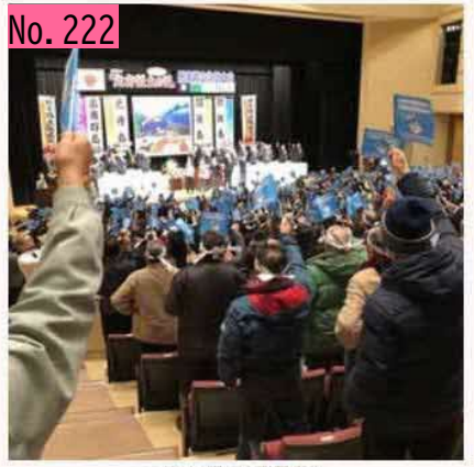
一日も早い返還を! by 原点の地