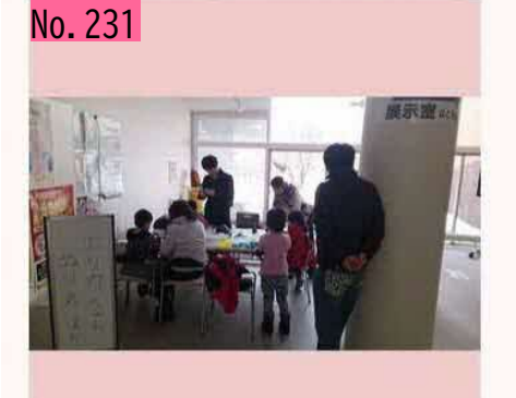
2019年北方領土の集い(ニホロ) ※ エリカちゃん のぬりえ、パーパークラフト、粘土で遊ぼう~