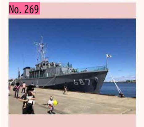
昨年のかに祭りの時に、海上自衛隊の掃海艇 「いずしま」が根室港に入港。内部も見学させ てもらえました。日々、日本を守ってくれてい る海自隊員の方々に感謝です。