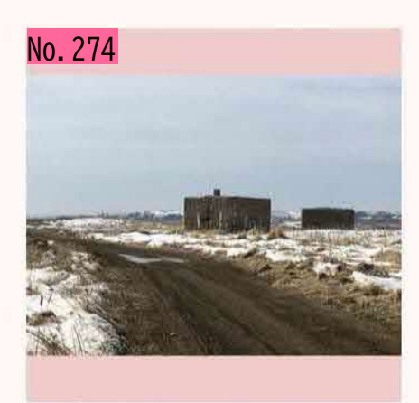
奥に見えるのは、根室のトーチカ。荒涼とした 風景で思わず泣きたくなります。ちなみに、こ こと落石地区の方で、一昨年、女優の新垣結衣 さんが某証券会社のCM撮影を行っていたよう です。「ガッキー 根室」で検索するとヒットし ます。根室には、ロケ地に向いた場所が多いよ うな気がします。 by のび太