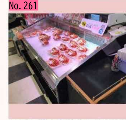
根室では、新鮮な花咲ガニがスーパーで皆さん のお越しをお待ちしています。安いし、とても 美味しいですよ。 by ハナサキガニ