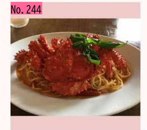
根室に来て領土問題を考えつつ、地元料理も味 わおう! by のぴ太