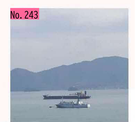
北方四島交流船えとぴりかは、瀬戸内海で冬を 過ごしています。遠く広島で北方領土問題を身 近に感じることができる貴重な機会です。