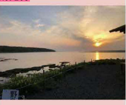
東梅のレイクサンセットさんからの夕日。写真 だと伝えられなくて残念ですが、肉眼で見ると もっともっと綺麗に見えます。