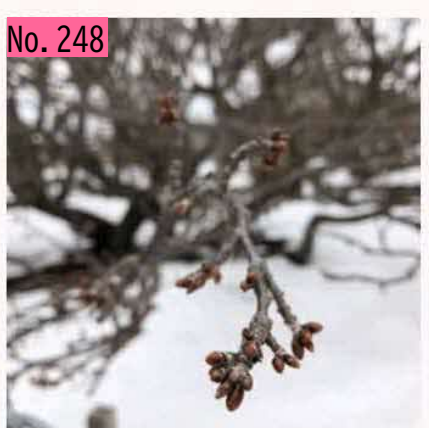
2月最終日の清隆寺のチシマザクラ。あと2ヶ月 ちょっとで満開でしょうか。根室の雪解けも進 んできました。楽しみです。 by 根室-年目