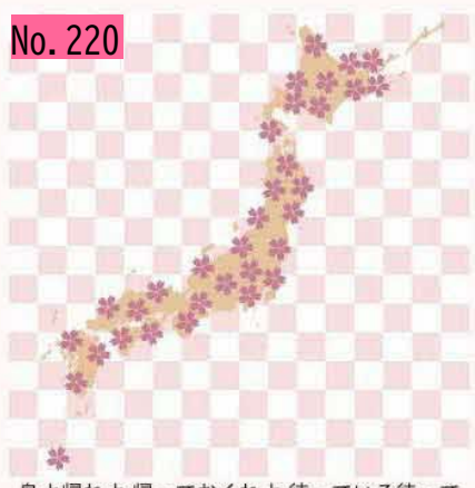
島よ帰れよ 帰っておくれよ 待っている待って いるよ... みんな待ってる いくとせ月も 祈って る祈っているよ by スマイル