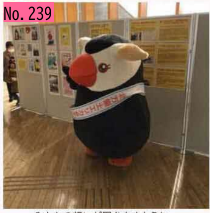
みんなの想いが届きますように。 by エリカちゃん見っけた。