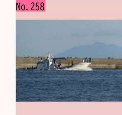
出航TO羅臼山?@根室港 by SG13