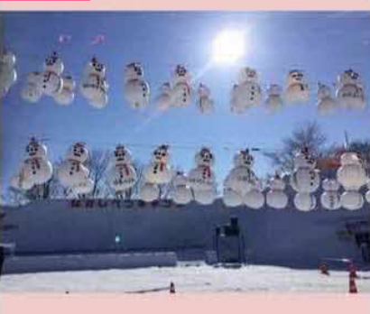
なかしべつ冬まつりの、かわいい雪だるま提 灯。空は雲ひとつない快晴ですが、この日の最 低気温は-26℃。会場では署名活動もありまし た。返還運動がんぱりましょう。