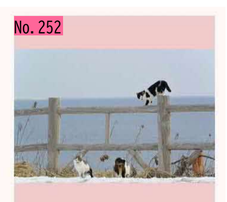
歯舞群島をバックに元気いっぱいの猫たち。早 く自由に行き来できる日が来ることを願いま す。