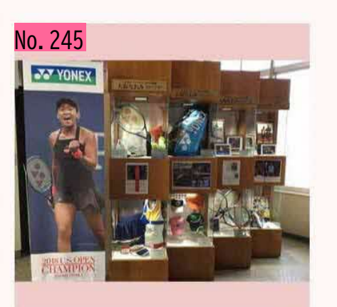
根室市役所の1階に大坂なおみ選手の特設プー スが3月末まであります。パワーをもらいに行 きましょう! by のび太