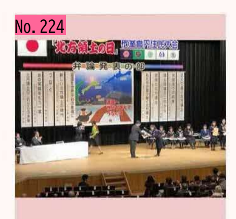
中学生による弁論発表の表彰式。若い世代の領 土への思い、会場の皆様にもしっかり伝わった と思います。根室の地からこの輪を日本中にも っともっと広げて行きたいですね。 by <sup>原点の地</sup>