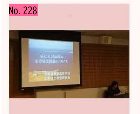
2019年北方領土の集いを二ホロで開催してます 【根室高校の研究発表は10時からです(^-^) by 根室振興局です