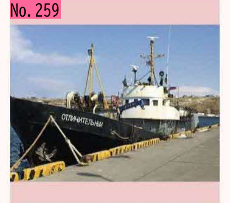
根室の花咲港に停泊中のロシア漁船です。日本 の漁船がたいてい白いのに、ロシア船はなぜか 黒ですね。寒い地域なので、日光で少しでも暖 めようとしているのでしょうか。