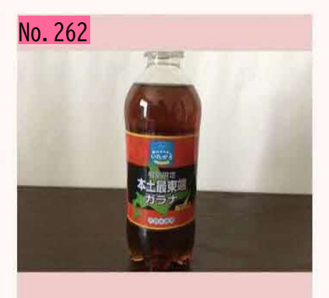
根室限定の本土最東端ガラナです。納沙布岬の 少し手前の珸瑤瑁(ごようまい)地区の店で販売 しています。中身は普通のガラナで、昆布は入 っていません。 by のび太