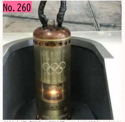
納沙布岬「四島の架け橋」にある"祈りの火"の 種火です。 by ネムロッ子