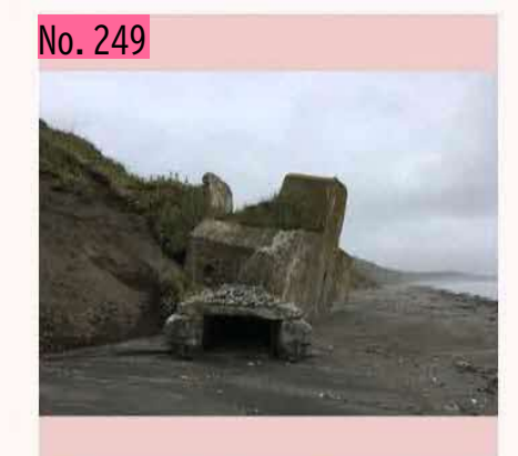
根室にあるトーチカ(防御陣地)の一つ。ここの は崩れています。トーチカは、ロシア語由来の 名称で、ほかにも、イクラ、ノルマ、アジト、 カンパなどがあるみたいです。