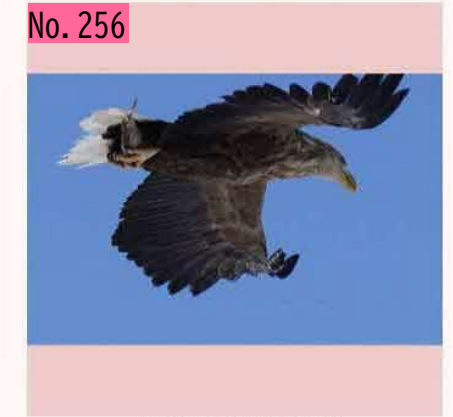
オジロワシ@根室風連湖