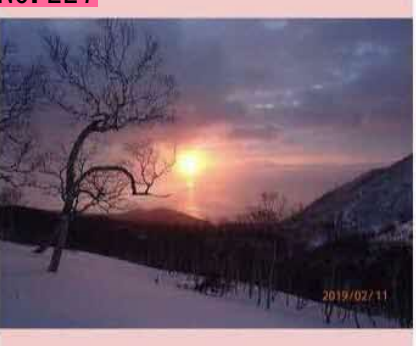
2月11日 国後からの日ノ出 還ってきますように