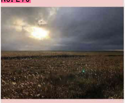
道道35号線から珸瑶瑁を撮影。かなり幻想 的。