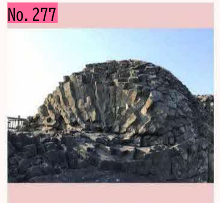
車岩の写真です。