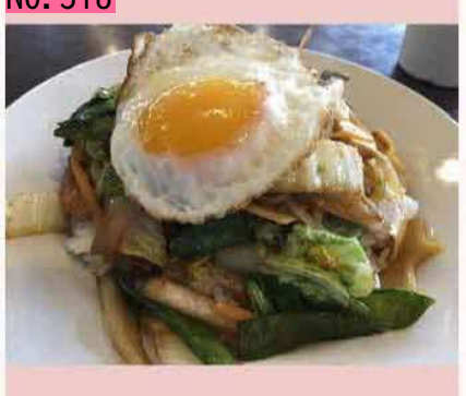
根室三大ライスの一つスタミナライスです。ラ イスの上にトンカツが載り、その上に野菜炒め と目玉焼きが載っています。トンカツは隠れて 見えません。野菜たっぷりで栄養バランスが良 いと思います。 by のび太