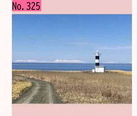
今日の根室は、すっきりと晴れ、ノッカマップ 岬から対岸の知床の山がよく見えました。 by のび太