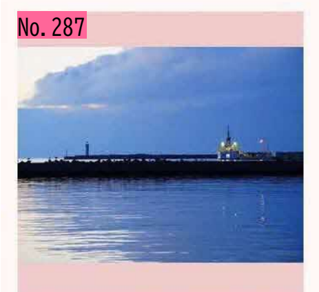
「えとびりか」国後島へ出向@根室港 船舶 「えとびりか」は、国の「四島交流等の実施及 び後継船舶の確保に関する方針」に従って建造 され、平成24年度から供用が開始された北方四 島交流等事業に使用する船舶です。 by SG13