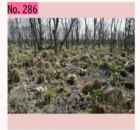
根室の湿地帯でよく見かけるこんもりとした草 の塊。やちぼうず、といいます。なんとなくゲ ゲゲの鬼太郎に出てきそうな感じ。ミズバショ ウとのコラボが春にはよく見られます。 by 春間近