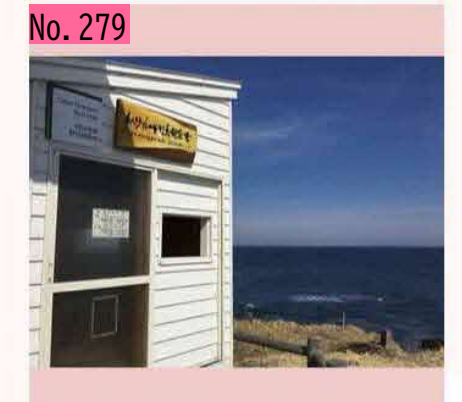
納沙布岬ハイド(野鳥観察小屋)です。灯台の先 に設置されていて、双眼鏡があれば、時期によ りますが、小屋の小窓から色々な海鳥を中のベ ンチに座ってゆっくり観察できます。雨風を避 けることができ快適です。一度覗いてみてくだ さい。無料です。