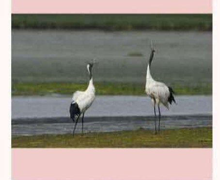
タンチョウ。春国岱にて。