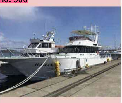
羅臼港に係留されている観光船です。冬はオオ ワシ、春以降はシャチやクジラの観察で、大活 躍のようです。今年は、シャチを見に是非乗船 したいです。国後島も間近に見えそうです。 by のび太