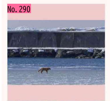
氷上を渡るキツネ@根室港2月 このように、 北方領土と本道の間でキツネの往来があったといわれています。