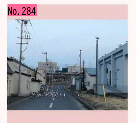
根室にはネコよりウミネコのほうが沢山いるか も。屋根の上にもきちんと整列。 <sub>by うみねこ</sub>