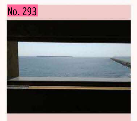
花咲港車石ハイド。ユルリ島、モユルリ島がよ く見えます。このハイドからは、オオワシ、オ ジロワシ、エトピリカなどなど多くの野鳥が見 られるみたい。 by サンセット