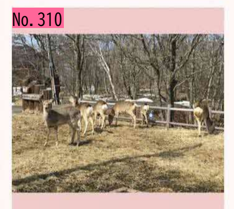
春国岱ネイチャーセンター付近のエゾシカファ ミリーです。余程空腹なようで、人が近づいて も逃げずに、夢中で道端の枯れ草を食べていま した。だんだん、人を恐れなくなって、近い将 来、奈良のシカのように、人からせんべいをも らって食べるようになるかもしれません。 by のび太