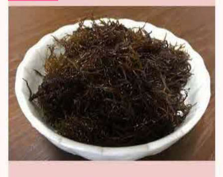
寒い時期に歯舞の方で漁が始まる生ふのり。味 噌汁に入れるとシャキシャキした食感と豊かな 風味で美味しいです。 byのび太