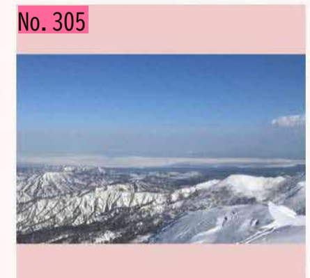
3月18日快晴 二日かかりの海別岳より国後 を望む 左上にうっすらと 月が