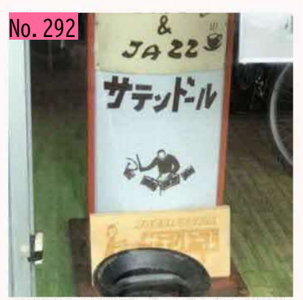
根室駅ちかくにサテンドールさんという素敵な ジャズ喫茶があります。ジャズを聴きながら美 味しいコーヒーが楽しめます。花咲線の待ち時 間にぜひ! by ねむねむ