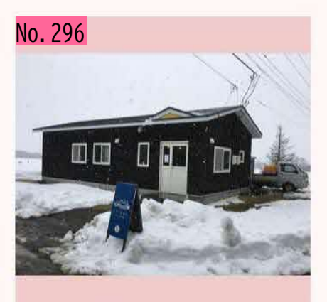
根室郊外の国道沿いにあるチーズ工房チカプ。 チカプは、アイヌ語で鳥を意味するそうで、販 売しているチーズにも鳥の名前がついていま す。個人的には、ハードタイプのシマフクロウ が好みです。夏場は、ソフトクリームも販売し ているので、是非立ち寄ってみてください。 by のび太