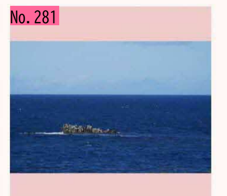
国後島東端の爺爺岳が微かに見えました@根室 牧の内(20180902)