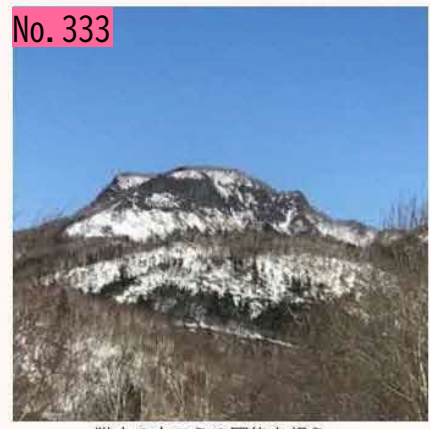
猫山の向こうの国後を想う。 by 根室労山