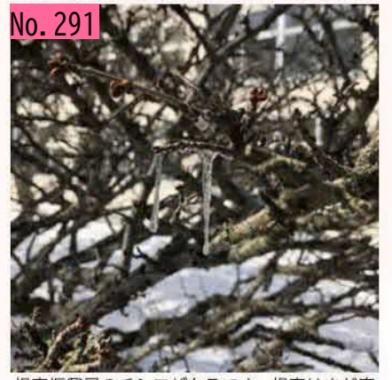
根室振興局のチシマザクラです。根室はまだ寒 いので、枝につららがついています。春の陽射 しを浴びて開花の時をじっと待っているようで す。