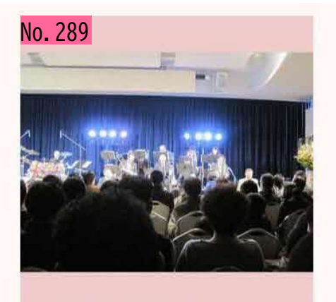
ビザなし交流にも参加しているEast Point Jazz Orchestraの「北海道地域文化選奨受賞記念 Winter LIVE 2019 流氷 part4 with Senri Kawaguchi」に行ってきました。立ち見が出る 盛況ぶり。根室のジャズは今日も熱い! by ここに幸あり