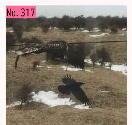
オオワシです。地面にくっきり影を捕らえまし た。単なる失敗? 自然豊かな地域です。 by バードマン