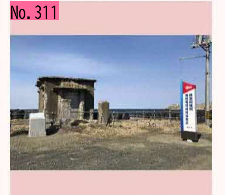
「根室国後間海底電信線陸揚施設」は、根室市 内にあります。当時、根室から択捉まで電信線 が繋がっていたとのことです。一度、立ち寄っ てみては。 by ハナサキガニ