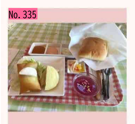
全国一位ご当地バーガーうますぎ!イン別海 by じょう