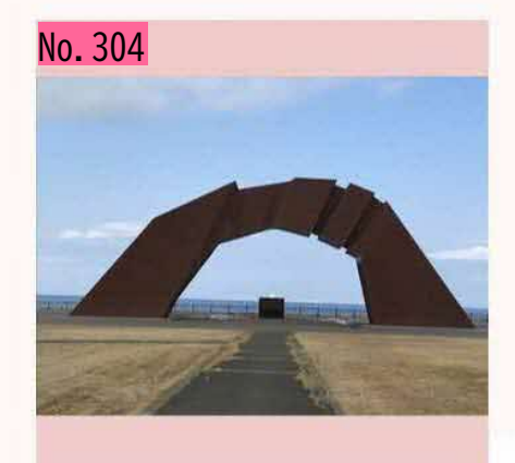
四島の架け橋と祈りの火です。 早期返還を切に 願っています。 <sub>by ウエナ</sub>