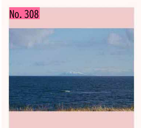
羅臼山(国後島)@牧の内(根室) 今朝は羅 臼山が綺麗でした!