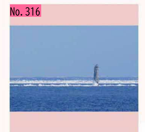
貝殻島灯台201902@納沙布