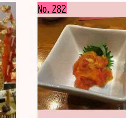
独特の風味で好き嫌いが分かれるホヤですが、 時々、無性に食べたくなります。特に、根室の 赤ホヤは、色鮮やかで、食欲をそそります。地 産地消で、地域を元気にし、返還要求運動も盛 り上げて行きましょう! by のび太