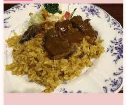
根室三大ライスの一つ、オリエンタルライス。 ドライカレーの上にデミグラスソースがかかっ たサガリステーキが載っています。