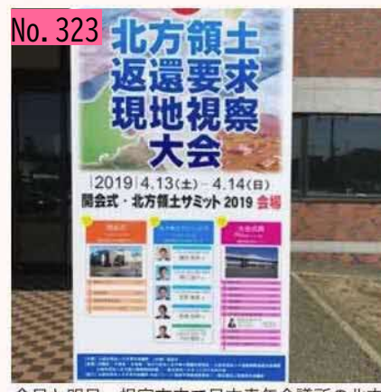
今日と明日、根室市内で日本青年会議所の北方 領土返還要求現地視察大会が開催されます。皆 さん是非足を運んでくださいね。 by ネムロッチ