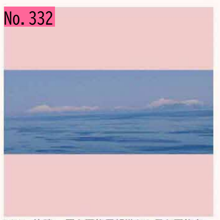
5/13、快晴。羅臼国後展望塔から見た国後島。 左の三角山がルルイ岳、右のおっぱい型が爺々 岳。これだけクリアに見えることは滅多にない と地元の人もいっていました。 早く戻してと主 張している感じです。