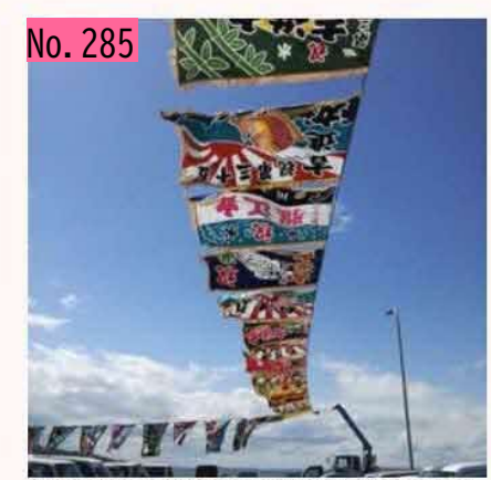
湾中漁協のお祭りで大漁旗がはためいていまし た。壮観!