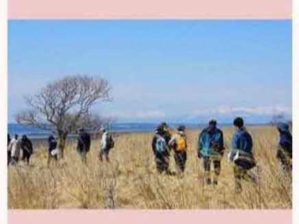
別海町の「ふるさと講座」に行ってきました (20190420) 野付半島の先端には、国後島へ 渡るための要所として、寛政 11 年(1799)に幕 府によって設置された「野付通行屋」の遺跡が 残されています。 普段は、立ち入り禁止区域な ので貴重な体験でした。 by SG13