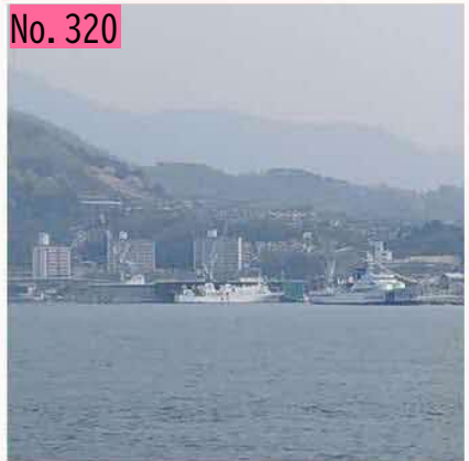
北方四島交流船えとぴりかは広島県呉市内の造 船所で定期点検を受けています。右側の船は海 猿で有名になった海上保安大学校の練習船こじ まです。