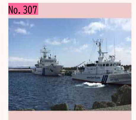
羅臼港に停泊中の巡視船2隻です。後ろは、砕 氷型巡視船のてしおです。流氷を割って進むこ とができます。1996年には、ロシアの要請で、 流氷に閉じ込められたロシア漁船を救出したこ ともあるそうです。 by のび太