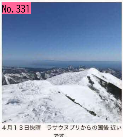
です。 by 根室労山