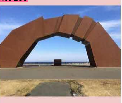
納沙布岬の「四島(しま)のかけ橋」に行ってき ました。返還実現への固い決意を象徴するモニ ュメントです。モニュメント下の「祈りの火」 も勢いよく燃えていました。今月22日には、駐 日ロシア大使が根室市に来て講演するようで す。大使には、返還実現に向けた根室市民の強 い気持ちを感じてもらいたいですね。 by のび太