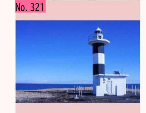
今日の国後島@ノッカマップ岬 泊やま&羅臼山 は綺麗にみえましたが、爺爺岳は全く見えず。 次回に期待! by SG13