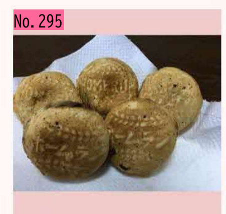
根室の花咲港近くには、ホームラン焼きという 名のおやきを売っている店があります。根室の 人であれば知らない人はいないようです。直径 6センチくらいの小さなおやきで、中はつぶ餡 が入っています。税込み1個60円。このお店で は、ラーメンも提供しているので、今度、食べ てみたいです。 by のび太