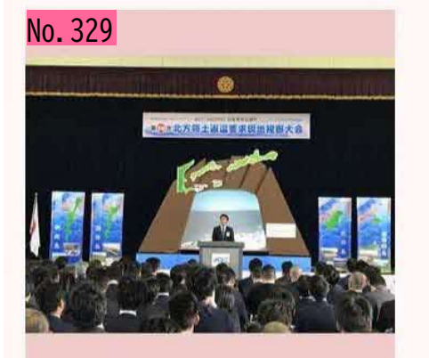
本日は、昨日に引き続き根室市内で日本青年会 議所さんの"北方領土返還要求現地視察大会"が 開催されました。届け、皆さんの想いよ。 by ハナサキガニ