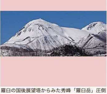
的な迫力です!! by とんちゃん