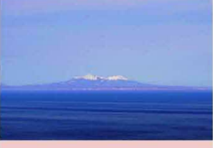
羅臼山(国後)@羅臼展望台20190414 今日の羅 臼は天候も穏やかで国後島全体が見渡せまし た。特に羅臼山が綺麗でした。