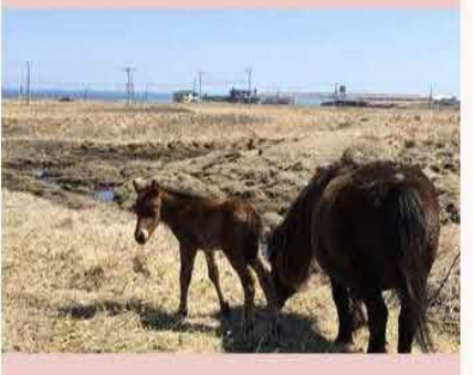
根室市郊外にある北方原生花園は、まだ花の時 期には早いですが、ポニーの親子の仲の良い様 子を見ることができます。