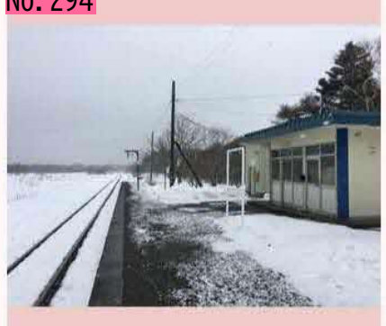
JR花咲線の初田牛(はったうし)駅が昨日3月15 日で廃止されました。一目見ておこうと、1日 遅れで見に行ってみると、すでに駅名の看板は 撤去されていました。花咲線存続に向けた取組 みが活発となっている中での廃止で残念です。 byのび太