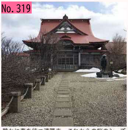
静かに春を待つ清隆寺。これからの桜のシーズ ンが楽しみです。