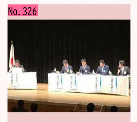
日本青年会議所さんによる"北方領土サミッ ト"が根室市内で開催されました。