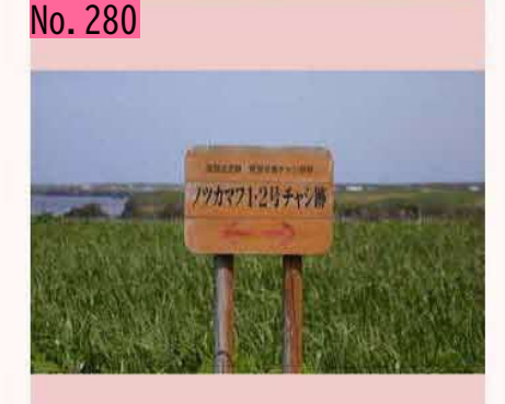
北方領土にもチャシがあるのではと思います。 by G13