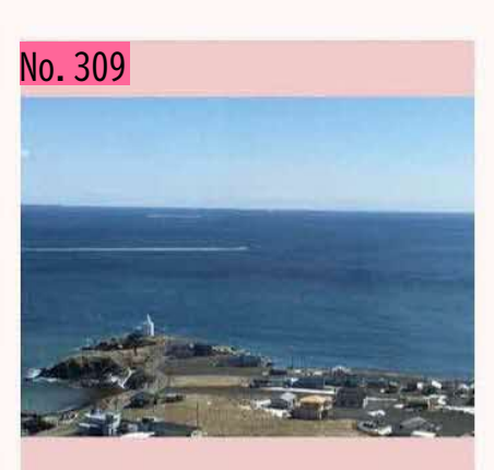
納沙布岬オーロラタワーの地上96メートルから 灯台方向の眺めです。沖には貝殻島や秋勇留島 が見えます。海上に見える白い航跡は、巡視船 さろまのものです。