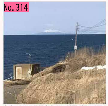
根室からは、爺爺岳がとても綺麗に望めます。 by ネムロッチ