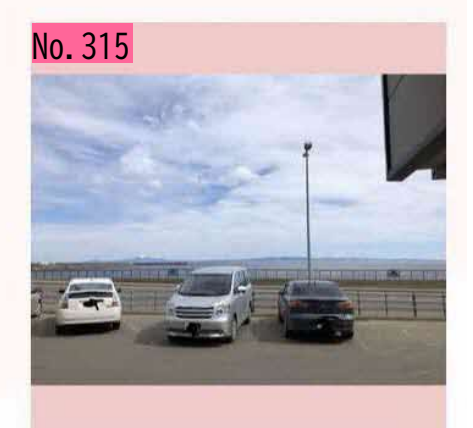
今日は羅臼の道の駅から国後島がばっちり見え ました。爺爺岳は存在感ありますね! by 根室2年目