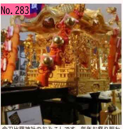
金刀比羅神社のおみこしです。毎年お祭り賑わ います☆