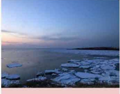
根室港に流氷が接岸しました。2年ぶりだそう です。そろそろ融けてしまいそうですが。 by 根室-年目