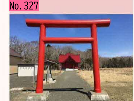
根室市東梅の国道沿いに神社があります。名称 は厚別稲荷神社。真っ赤な神社で元気がもらえ そうです。