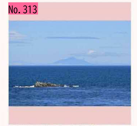
爺爺岳(国後島)@牧の内(根室)20180628