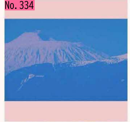
爺爺岳(国後島)@羅臼20190414