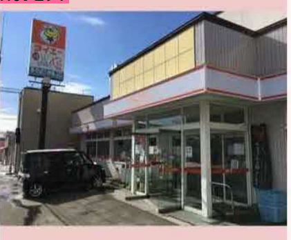
タイエーは根室市内に3店舗ある地元のコンビ ニ。やきとり弁当が有名ですが、店オリジナル のプリンやさんま節ラーメンのほか、根室産の 魚介類が売られているなど、地域色豊かなコン ビニです。 by のび太