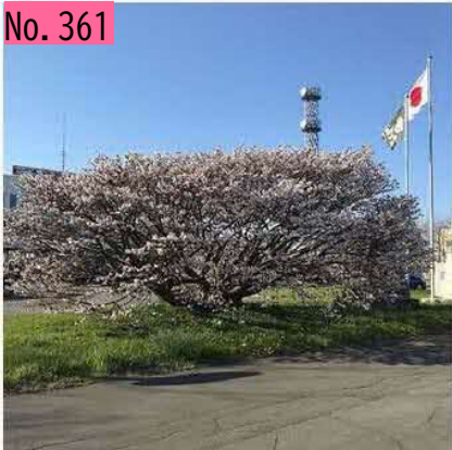
根室市役所の千島桜です。拡大して見てください。びっしり花が咲いています。 by ネムロッチ