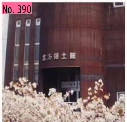
標津町北方領土館の前で元気よく育っているマチ自慢の千島桜です! by 標津支部長からの投稿