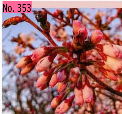
千島桜何分咲きR010508