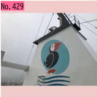
四島交流船のえとびりかに乗り、色丹島と択捉島に行って参ります!! #北方領土 by 清水基嗣