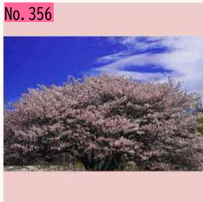
明治公園でお花見できそう♪ by ミキ