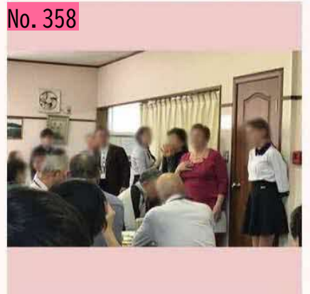
"ビザなし交流"に行ってきました。国後島の住民の皆さんと懇談し、大変有意義な時間を過ごすことができました。 by マイフレンド