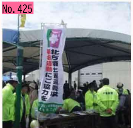
別海町尾岱沼で「えびまつり」やってます! 開始前から大賑わい! 署名活動もしてますよ。皆さんお立ち寄りください〜🍤 by えびまつり