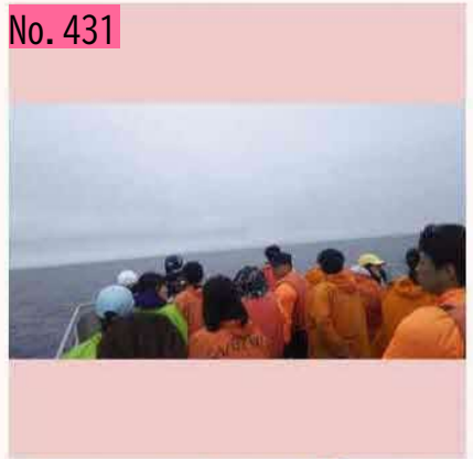
曇天の中、シャチ探してます〜🌧️18日間連続で観察できていたのですが.....国後島も見えにくく.....😞