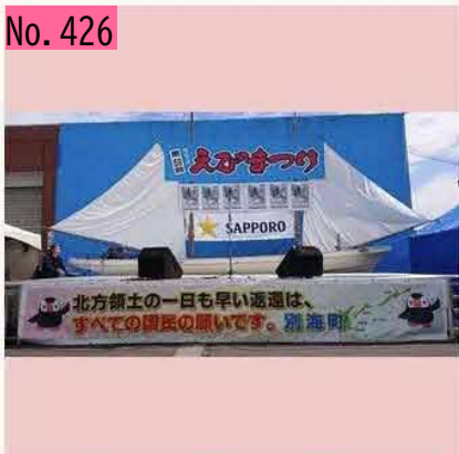
別海、えびまつり、大盛況! 北方領土、早く帰ってこい! by とんちゃん