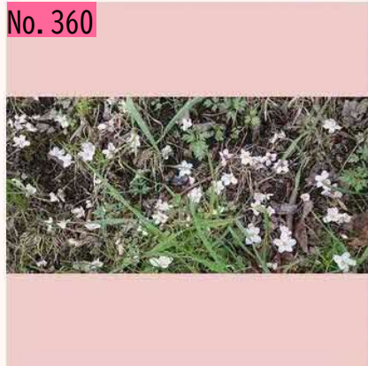
千島桜の根元です。花びらが散るソメイヨシノなどと違い、千島桜って花弁全体で落ちるんですね。早咲きは散り始めていますが、根室の千島桜はまだまだ見頃ですよ。