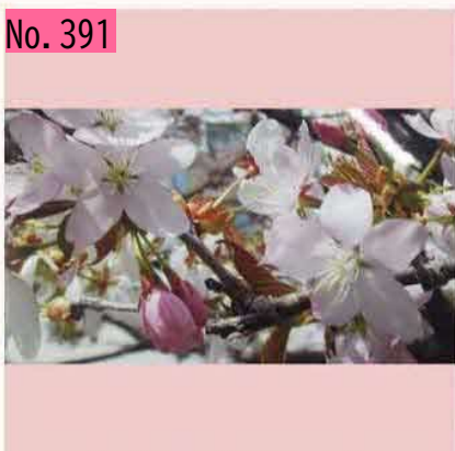
北方領土館前の千島桜アップです! by 標津支部長からの投稿