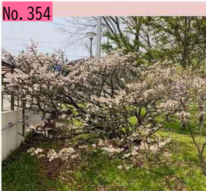
振興局前庭の千島桜です。市内では一足先に開花しました！ by 根室振興局