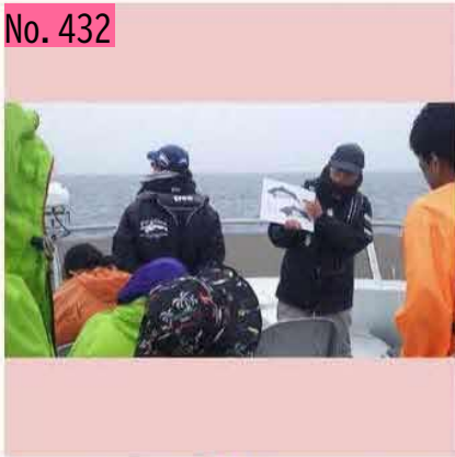
シャチ見えず...残念😞国後島も全く見えなくなってしまいました...😞羅臼港に戻ります🌊