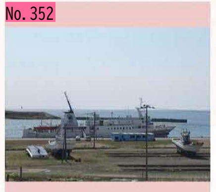
今年度の出航を待つ"えとびりか"、無事に渡航が終えられますように。。。 by ハナサキガニ