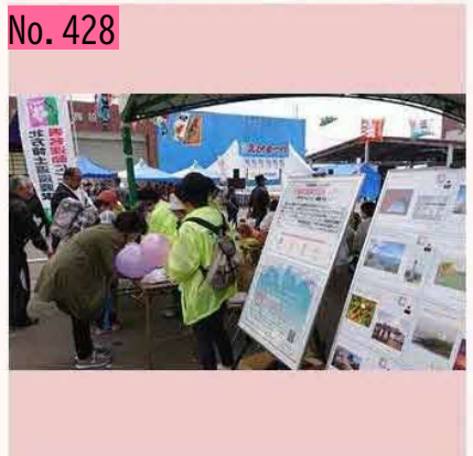
えびまつり会場、北方領土が早く帰ってくるように、たくさんの皆さんに応援してもらっています。 by ちゃちゃ