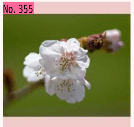
根室は未だ満開とは言えませんR010511@根室 明治公園 by 令和元