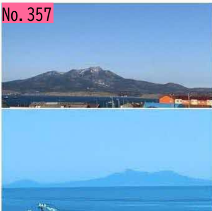
上: 古釜布から望む羅白山 下: 羅白町から望む羅白山