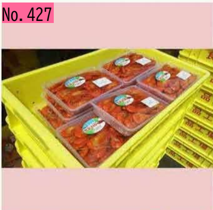
首脳会談結果には.....😞でもエビ🍤食べて元気出して、また頑張ろう👊 by 尾岱沼えびまつり