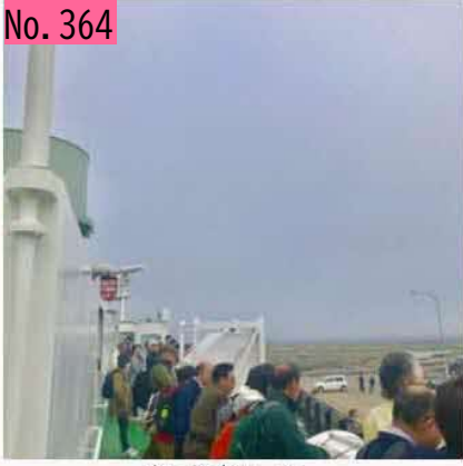
行って来ます。 by 北海の熊