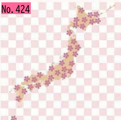
最近ロシア大統領が島は返さないといいました。それはないよ安倍さん頑張って、約束が違うヨ日本古来の島です🇯🇵 by べこだ君です