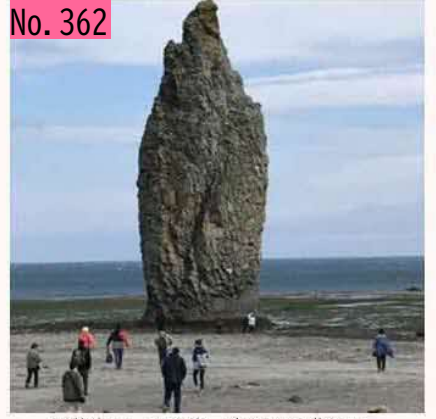
国後島ローソク岩。摩訶不思議なあ。