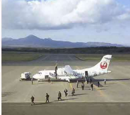
10/21 中標津空港発着、チャーター機により知床半島から根室半島を沿ったルートを航行する北方領土上空慰霊が実施されました▶ We were lucky with the weather ☺ by 次は10/25!