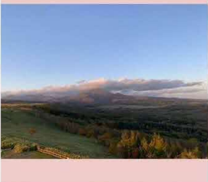
快晴！★武佐岳が綺麗に見えました！