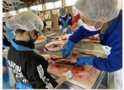
続いて、北方領土に元島民の方々が暮らしていた当時の主産業である漁業の体験学習として、新巻鮭作りを行いました。生徒の皆さんは怖がりながらも一生懸命に作っていました by 北方領土対策根室地域本部