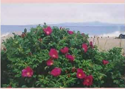
標津支部長が制作したポストカードからの1枚です。ハマナスの群生と後ろには国後島