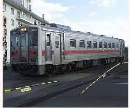
特殊プリント無しノーマル車輛です