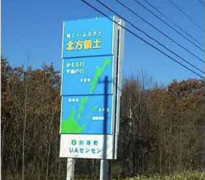
本日(10/25) 上空慰霊2日目▶快晴★です！ by ありがとう