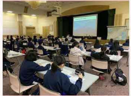
道では、中学生、高校生を対象に北方領土問題に対する関心を高めるための「北方領土体験学習」を実施中です！写真は職員による北方領土の概要説明。生徒のみなさんは一生懸命にメモをとり、熱心に聞いていました！