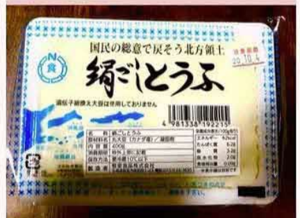
小さいところから運動を！国民の総意で戻そう北方領土！ by 木綿派