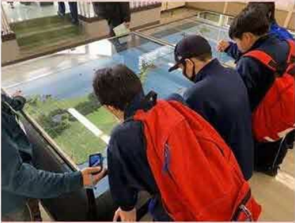
北方領土間の見学での様子です。館内では、ビザなし交流の写真や北方四島の概要についてのパネルを見学したほか、返還要求署名簿に署名していた生徒もいました