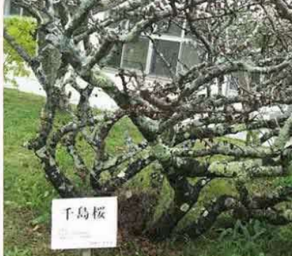
今シーズンはとても寂しいことになりました。いつもならこの時期気にもかけない今の姿の千島桜を撮ってみましたよ。来週は上空慰霊です by 千島桜