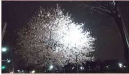
自然の豊かな場所に赴いてみたいですね。 by はりこ