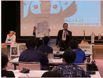
続いては、元島民による語り部の様子です。当時の様子や交流事業について、紙芝居を通して楽しく説明していただきました！