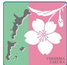
北方領土返還要求運動の シンボルの花「千島桜」