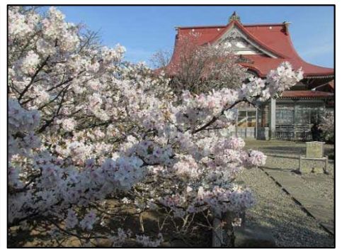
「千島桜」 (北海道各地)