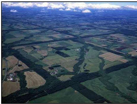
「根釧台地の格子状防風林」 (中標津町など)

「次世代に引き継ぎたい北海道ならではの宝物」、それが北海道遺産です。豊かな自然や北海道に生きてきた人々の歴史、文化、生活・産業など様々な有形無形の財産の中から、道民参加によって選ばれました。