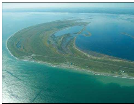
「野付半島と打瀬舟」 (別海町、標津町)