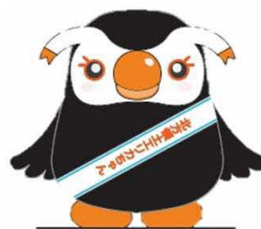
北方領土イメージキャラクター 「エリカちゃん」

北海道根室振興局地域創生部地域政策課 〒087-8588 北海道根室市常盤町3丁目28番地 Tel. 0153-23-6052 FAX. 0153-23-6182 ホームページアドレス http://www.nemuro.pref.hokkaido.lg.jp