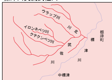
標津川支流武佐川