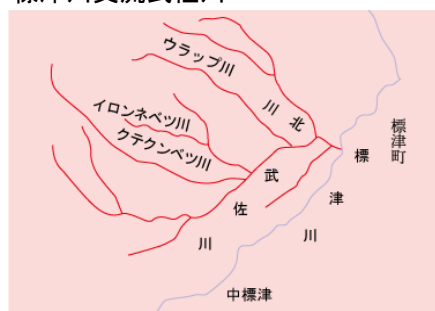
標津川支流武佐川