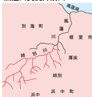
風蓮川支流姉別川