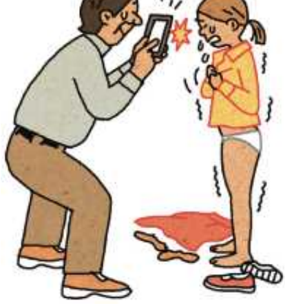
せいてきぎやくたい 性的虐待