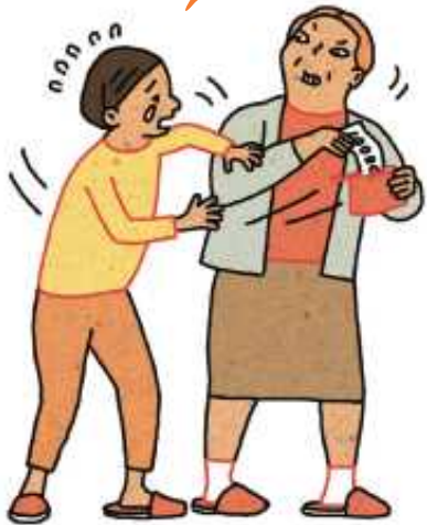
けいざいてきぎやくたい 経済的虐待

【このほかにも】 給料から知らないお金が引かれている 自分の携帯電話を他人が使っている 自分の通帳を見せてもらえない など