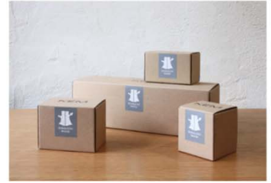
自社製品（例：製品パッケージへの印字）