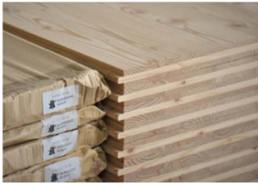
自社製品（例：製品ラベルへの印字）