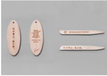
販促グッズ（例：木製キーホルダー、菓子楊枝）

道産木材製品の魅力を伝えたいという思いをもつ企業や、応援してくださる方などが、様々な場面でロゴを使用し、HOKKAIDO WOODを広めています。