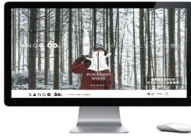
WEB上の使用（例：自社サイトでの活用）