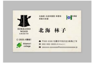
印刷物への使用（例：名刺）