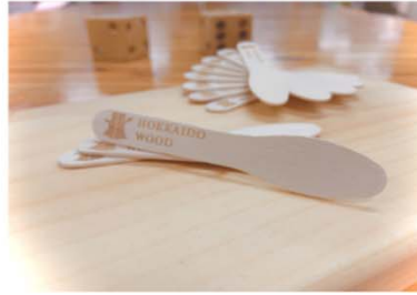
自社製品（例：製品への印字）