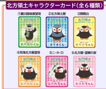
北方領土キャラクターカード